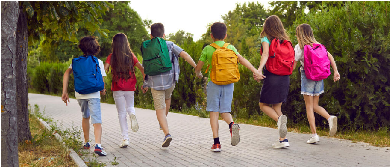
Kinder laufen Hand in Hand einen Weg entlang

Inklusion heißt, dass Menschen mit und ohne Behinderung an allen Lebensbereichen gleichberechtigt teilhaben. Dazu gehört auch das gemeinsame Lernen von Kindern und Jugendlichen mit und ohne sonderpädagogischen Förderbedarf. Der „Bayerische Weg der Inklusion“ eröffnet diesen Schülerinnen und Schülern passgenaue Bildungswege in unserem differenzierten und durchlässigen Schulwesen in Bayern.