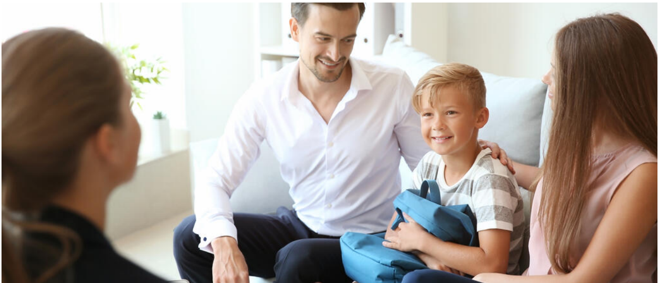
Ein junges Paar sucht mit Kind eine Beratung auf

Bayern bietet bei Fragen der Inklusion ein dichtes und stabiles Beratungs- und Unterstützungsnetzwerk für Schülerinnen und Schüler, Erziehungsberechtigte, Lehrkräfte und Schulen.